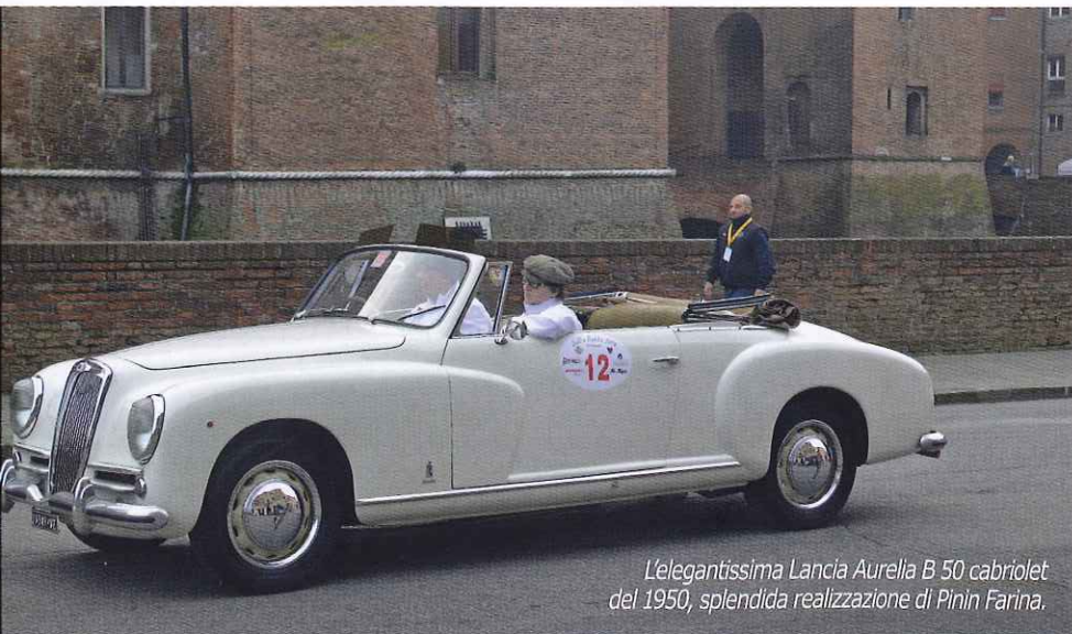
L'elegantissima Lancia Aurelia B 50 cabriolet del 1950, splendida realizzazione di Pinin Farina.