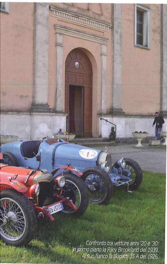
Confronto tra vetture anni '20 e '30; in primo piano la Riley Brookland del 1939. Al suo fianco la Bugatti 35 A del 1926.

È stato così anche per quest'edizione, svoltasi il 22-23 marzo. Il copione della partenza e dell'arrivo (che ha come "quinta" lo splendido castello Estense) non è cambiata. La bellissima piazza ciottolata ha ancora una volta accolto le vetture dei partecipanti, garantendo nello stesso tempo un interessante spettacolo ai ferraresi e ai turisti. Sono state 57 le vetture partecipanti: tra queste sono da segnalare le due Bugatti 35 A (del 1925 e del 1926), la Lancia Aprilia Cabriolet Pininfarina del 1938 e una rara Hotchkiss "Anjou 1350" del 1950.