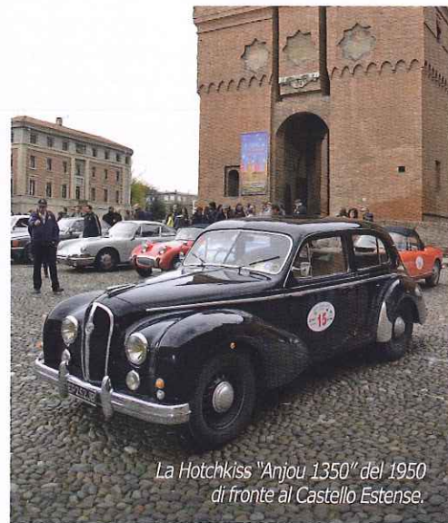
La Hotchkiss "Anjou 1350" del 1950 di fronte al Castello Estense.