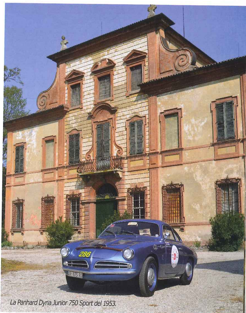
La Panhard Dyna Junior 750 Sport del 1953.

Il giorno successivo un altro grande momento culturale è stato la visita al Museo della Bonifica, in una struttura che ancora oggi accoglie le enormi idrovore che permettono al territorio di mantenere il corretto "assetto" idrogeologico. Lo spuntino nell'Oasi di Valle Santa ha poi preceduto il passaggio di fronte al fienile dov'è stata costruita la prima Bugatti. Un doveroso omaggio prima delle prove finali, avvenute nella piazza del Castello. La sobria ed efficace cerimonia di premiazione, avvenuta all'interno del Teatro Comunale, ha concluso "Valli e Nebbie" 2014. ■